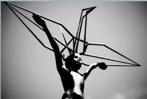
Sadako's statue in Hiroshima

http://kamoda.smugmug.com/Other/%E5%BA%83%E5%B3%B6-Hiroshima-1/463603796c035f2f730/316946110_te2M4-L.jpg